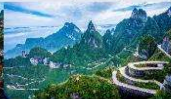
ถนน 99 โค้ง