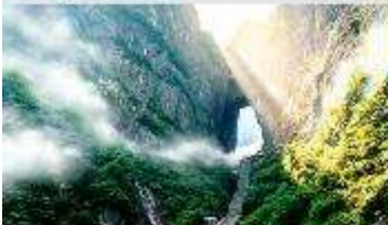
ประตูละคร