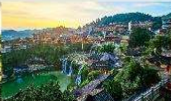
เมืองโบราณฝูหรงเจิน