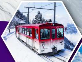
นั่งรถไฟใต้ดินสวิส