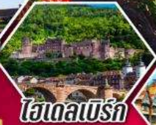
ไฮเดลเบิร์ก