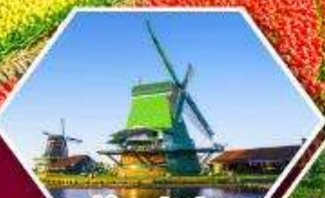
หมู่บ้านกังหันลม ซานส์ตีบส์