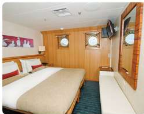
Junior Suite Plus & Junior Suite