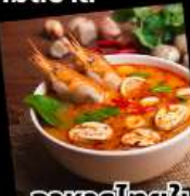
อาหารไทยในไคโร