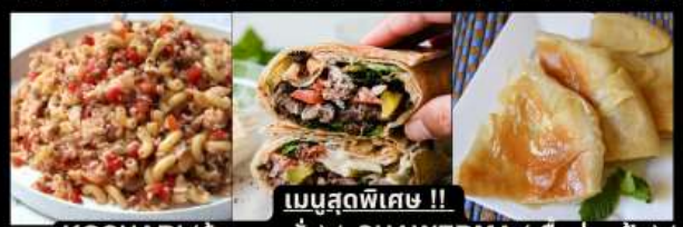
เมนูสุดพิเศษ !! KOSHARI (ข้าวคั่วกั่ว) / SHAWERMA (เนื้อห่อแป้ง) / FITEER BALADI (พิซซ่าอียิปต์)