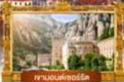
ภูเขาไฟคองกรีโต