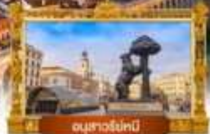
อนุสาวรีย์ทมิฬ

เมนู พิเศษ! จิวเวลีแอม + ทุยกับอิมเสียงชื่อ