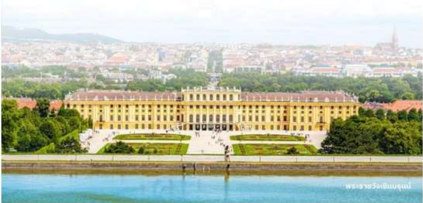
พระราชวังเฮินบรุนน์

อิสระอาหารกลางวันตามอัธยาศัย (ท่านสามารถเลือกรับประทานอาหารได้ภายใน OUTLET)