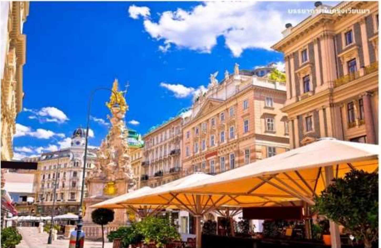
บรรยากาศในกรุงเวียนนา

จากนั้นนำท่านถ่ายรูปกับ วิหารเซนต์สตีเฟน วิหารที่ตั้งตระหง่านอยู่กลางกรุงเก่าเวียนนา เป็นศิลปะโรมาเนสก์ โดดเด่นด้วยการตกแต่ง หลังคากระเบื้องสีส้มสวยงาม