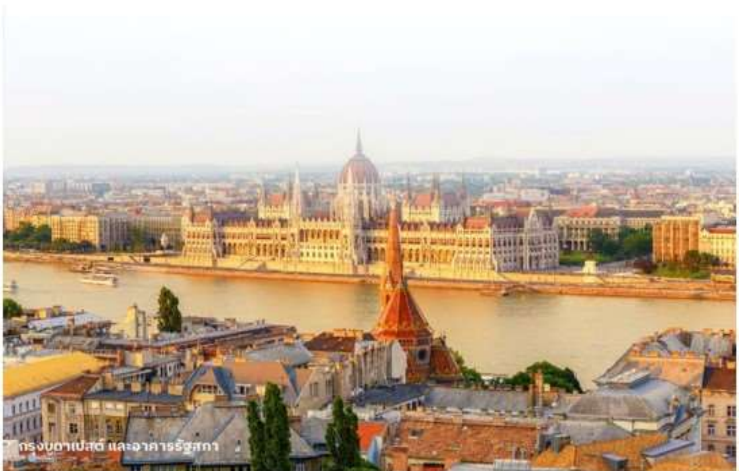
กรุงบูดาเปสต์ และอาคารรัฐสภา

นำท่านเข้าสู่ที่พัก Park Inn By Radisson Budapest หรือเทียบเท่า