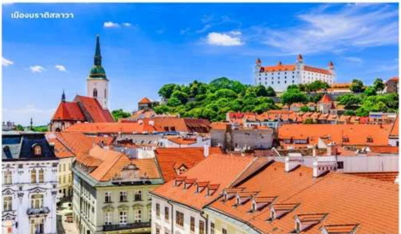
เมืองบราติสลาวา

จากนั้นนำท่านเดินทางสู่ เมืองบราติสลาวา ประเทศสโลวาเกีย ใช้เวลาเดินทางประมาณ 3 ชั่วโมง หรือมีชื่อเรียกอย่างเป็นทางการคือ สาธารณรัฐสโลวัก เป็นประเทศขนาดเล็กที่เพิ่งเข้าร่วมเป็นสมาชิกใหม่ของสหภาพยุโรป เป็นประเทศไม่มีทางออกสู่ทะเล แต่เมืองหลวงแห่งนี้เป็นเมืองที่มีชีวิตชีวาและยังเต็มไปด้วยวัฒนธรรมเก่าแก่ จากนั้นนำท่านถ่ายรูป ปราสาทบราติสลาวา ปราสาทเก่าแก่ที่ตั้งอยู่เหนือแม่น้ำดานูบ เมื่อขึ้นไปบนจุดที่ตั้งของปราสาทจะมองเห็นวิวทิวทัศน์เมืองสโลวาเกียได้ทั่วทั้งเมือง จากนั้นนำท่านเดินทางสู่ ย่านเมืองเก่าบราติสลาวา เป็นที่ตั้งของ ประตูมิคาเอล (Michael's Gate) เป็นประตูและป้อมปราการของเมืองเพียงแห่งเดียวที่ยังคงถูกเก็บรักษาไว้ตั้งแต่สมัยศตวรรษที่ 14