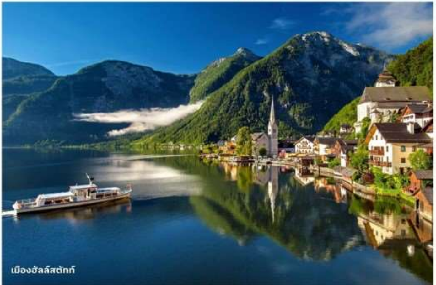
เมืองฮัลล์สตัดท์