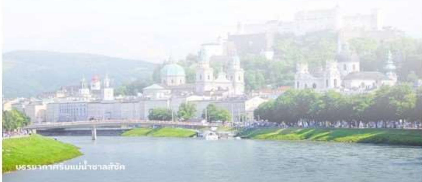
บรรยากาศริมแม่น้ำซาลส์บวร์ค

บริการอาหารค่ำ ณ กัตตาการ นำท่านเข้าสู่ที่พัก FourSide Salzburg หรือเทียบเท่า