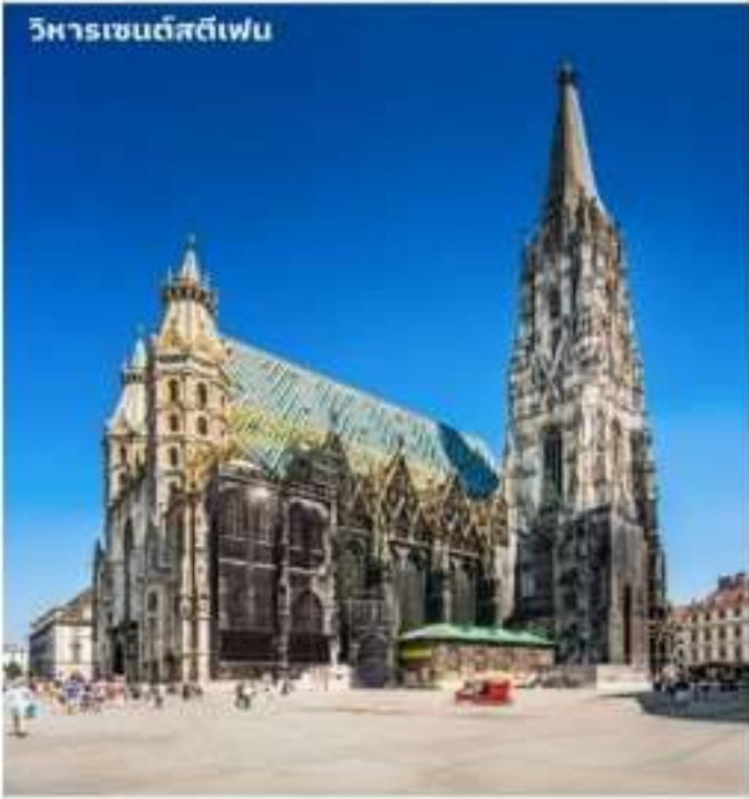
วิหารเซนต์สตีเฟน

นำท่านเดินทางสู่ ย่านถนนคาร์นทีเนอร์ ถนนใจกลางกรุงเวียนนา ถนนสายนี้เป็นถนนการ ค้าใจกลางเมืองที่เชื่อมระหว่างถนนวงแหวนริงส ตราเซกับจัตุรัสสเตฟาน ท่านจะได้พบกับโรงละคร หรือโอเปร่าเฮาส์