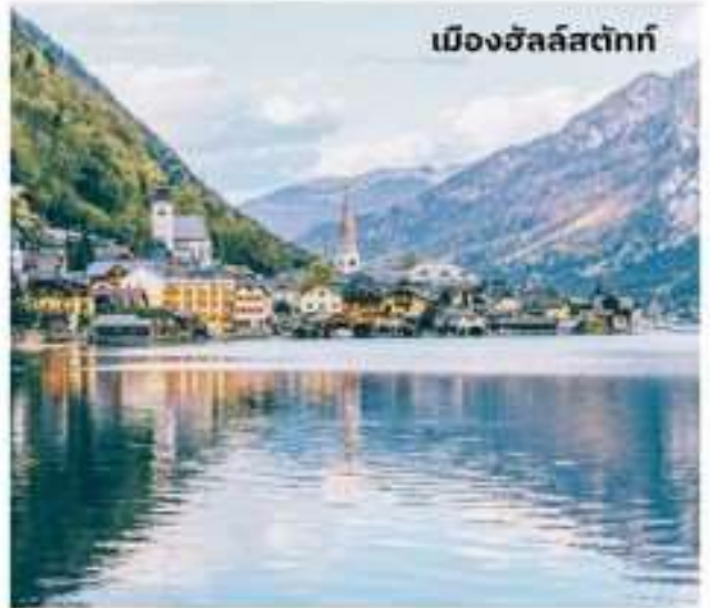
เมืองฮัลล์สตัดท์

บริการอาหารเช้า ณ ห้องอาหารของโรงแรม นำท่านเดินทางสู่ ฮัลล์สตัดท์ ใช้เวลาเดินทางประมาณ 1.30 ชั่วโมง หมู่บ้านมรดกโลกแสนสวย อายุกว่า 4,500 ปี เมืองที่ตั้งอยู่ริมทะเลสาบ โอบล้อมด้วยขุนเขา และป่าสีเขียวขจีสวยงามราวกับภาพวาด กล่าวกันว่าเป็นเมืองที่โรแมนติกที่สุดในออสเตรีย อิสระท่านชมเมืองฮัลล์สตัดท์ (Hallstatt) ออสเตรียให้ฉายาเมืองนี้ว่าเป็นไข่มุกแห่งออสเตรีย และเป็นพื้นที่มรดกโลกของ UNESCO เพียงเดินเที่ยวชมเมืองก็เสมือนหนึ่งท่าน อยู่ในภวังค์แห่งความฝัน