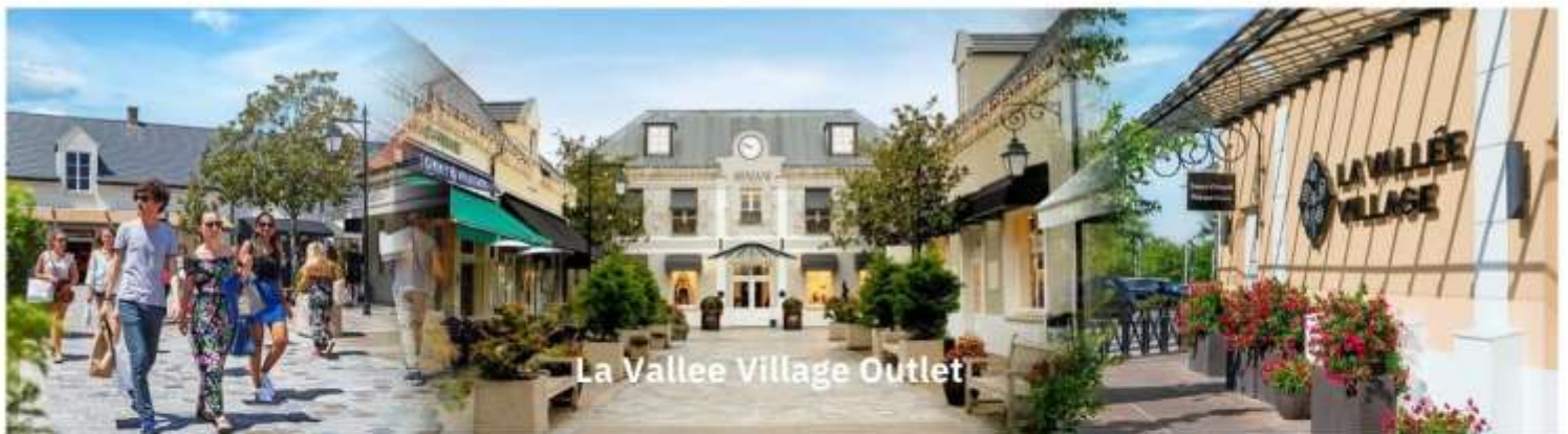
La Vallee Village Outlet

ถึงเวลาอันสมควรนำท่านเดินทางสู่ เมืองแร็งส์ (Reims) ใช้เวลาเดินทางประมาณ 1.45 ชั่วโมง เป็นเมืองที่ตั้งอยู่ในแคว้นซีองปาญ-อาร์แดน แคว้นที่ได้รับการยกย่องว่าเป็นถิ่นกำเนิดของแชมเปญ