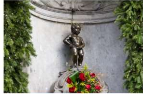
รูปปั้นแมนเนเก่นพิส

นำท่านไปชม รูปปั้นแมนเนเก่นพิส รูปปั้นเจ้าหนูน้อยที่โด่งดัง อิสระให้ท่านเดินเล่นชมเมืองหรือเลือกซื้อสินค้าของเมืองอาทิ ช็อคโกแลต เบลเยี่ยมผลิตช็อคโกแลตกว่า 172,000 ตันต่อปี และมีร้านขายช็อคโกแลต กว่า 2,000 ร้าน, ผ้าปักลูกไม้ หรือลิ้มลองวาฟเฟิลของอร่อยที่หาชิมได้ไม่ยาก