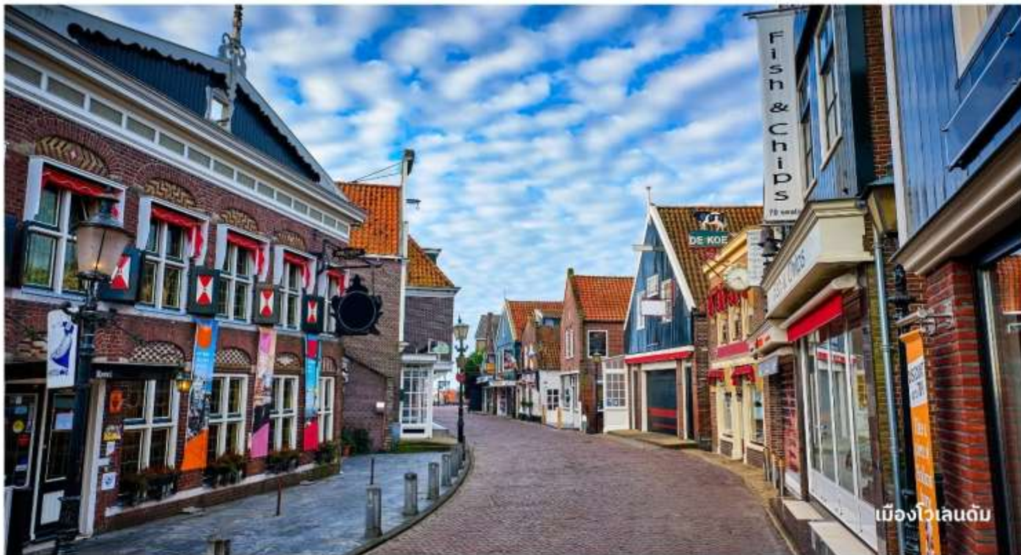
เมืองโวเลนดัม

จากนั้นนำท่านเดินทางสู่ เมืองอัมสเตอร์ดัม เมืองหลวงของประเทศเนเธอร์แลนด์