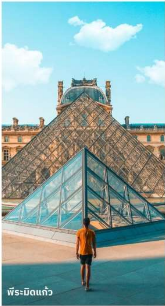
พีระมิดแก้ว