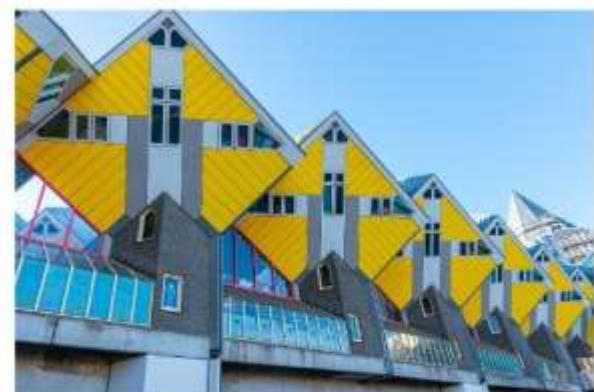
บ้านลูกเต๋าโค้คคุมุส

นำท่านถ่ายรูปกับ บ้านลูกเต๋าโค้คคุมุส (Kijk Kubus The Cubic Houses) กลุ่มอาคารเหล็องชาวทรงลูกเต๋า 39 หลัง ซึ่งได้รับรางวัลชนะเลิศการออกแบบสาขาประหยัดพลังงาน โดยสถาปนิกนาม Piet Bloem