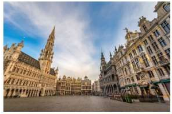
จัตุรัสกรองปลาช

จากนั้นนำท่านสู่ จัตุรัสกรองปลาช จตุรัสอันงดงามที่สุดแห่งหนึ่งของยุโรป ได้รับการยกย่องจากนักท่องเที่ยวทั่วโลก หรือแม้แต่อาร์คดัชเชสอิสซาเบลลา ธิดาของกษัตริย์ฟิลิปที่ 2 แห่งสเปน, วิกเตอร์ ฮูโก และชาร์ลส โบเดอแลร์ สองนักเขียนชื่อดังยังกล่าวถึง