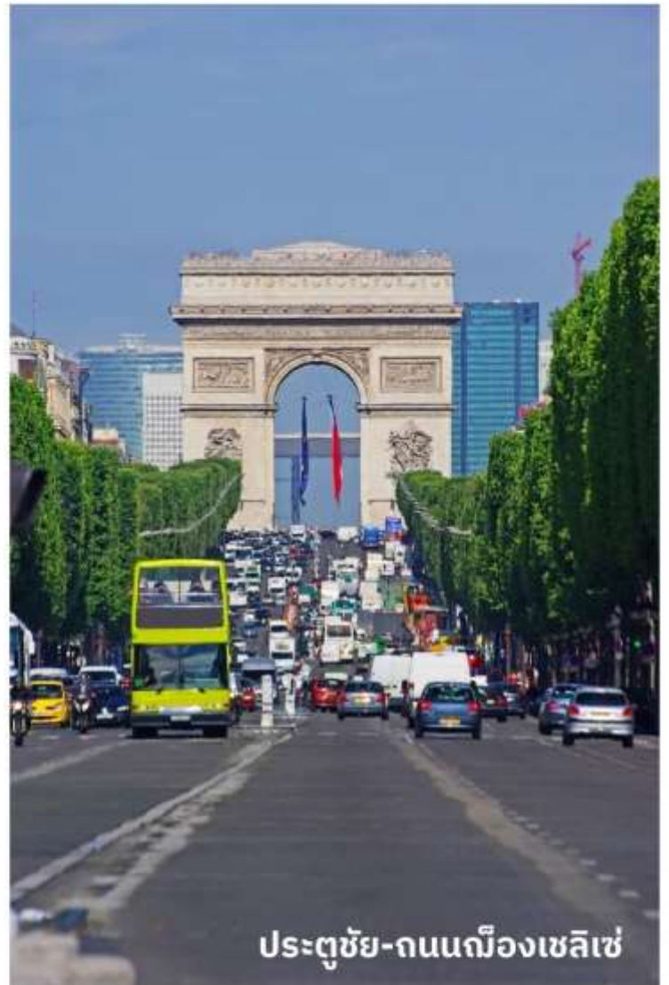
ประตูชัย-ถนนฌ็องเซลิเซ่

จากนั้นนำท่านเดินทางท่องเที่ยวตามสถานที่ที่มีชื่อเสียงของกรุงปารีส