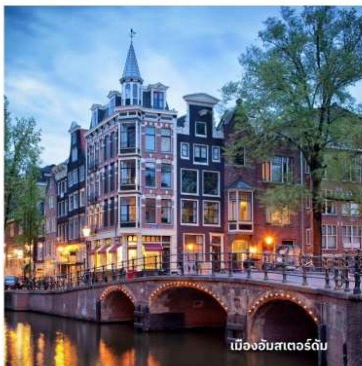
เมืองอัมสเตอร์ดัม