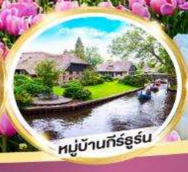
หมู่บ้านกีร์ธูร์น