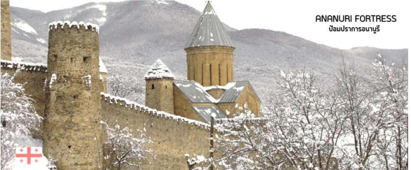
ANANURI FORTRESS ป้อมปราการอนานูรี

นำท่านชม ป้อมอนานูรี (ANANURI FORTRESS) ป้อมปราการเก่าแก่ ที่มีกำแพงล้อมรอบ ตั้งอยู่ริมแม่น้ำอาร์กี สร้างขึ้นในสมัยศตวรรษที่16-17 ภายในยังมีโบสถ์ 2 หลังสร้างอย่างงดงามและยังมีหอคอยทรงสี่เหลี่ยมสูงใหญ่ตั้งตระหง่านอยู่ ทำให้เห็นทัศนียภาพทิวทัศน์อันสวยงามด้านล่างจากมุมสูงของป้อมปราการนี้ (ใช้เวลาเดินทางประมาณ 1.10 ชั่วโมง)