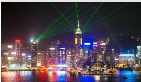
Symphony of Lights