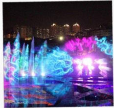
โชว์น้ำสามมิติ OCT BAY WATER SHOW