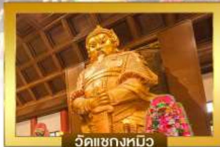
วัดแซงหมิว