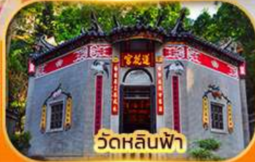
วัดหลินฟา