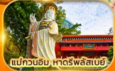
แม่กวนอิม หาดรีพลัสเบย์