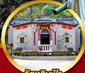
วัดหลินฟ้า โชคกลาง และ ความมั่งคั่ง