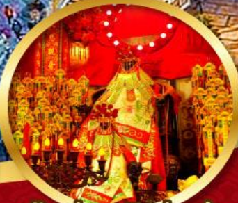
เจ้าแม่กวนอิมอ้อฮง นมัสการองค์เจ้าแม่กวนอิม อายุกว่า 600 ปี