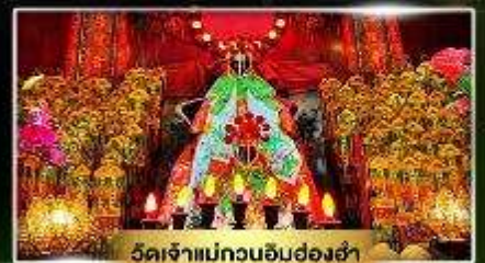
วัดเจ้าแม่กวนอิมฮ่องฮ่า