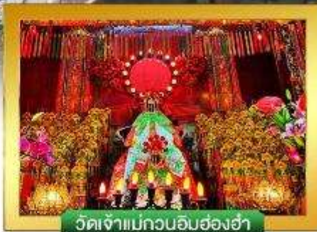
วัดเจ้าแม่กวนอิมฮ่องฮ่า