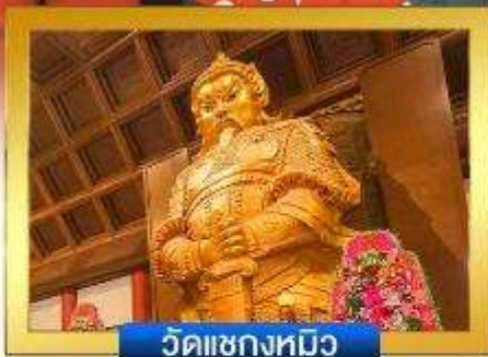
วัดเขangkงหมิว

📍 อิสระช้อปปิ้งย่านจิมซาจู้ & คอสเวย์เบย์