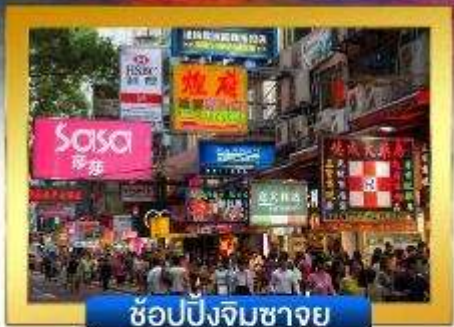
ช้อปปิ้งจิมซาจู้