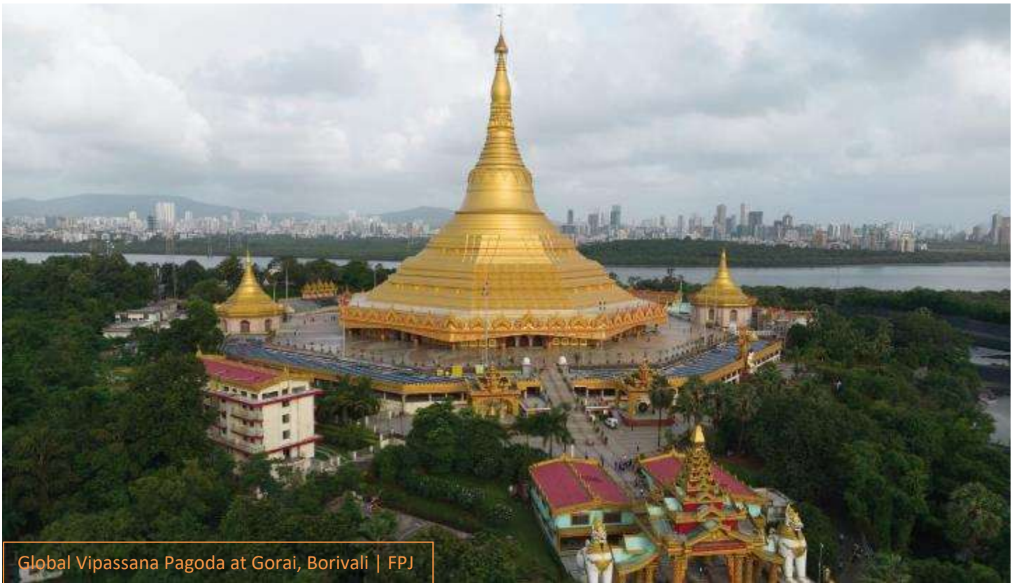
Global Vipassana Pagoda at Gorai, Borivali