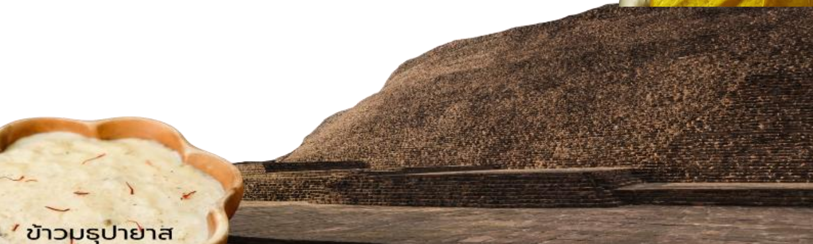
ข้าวมธุปายาส