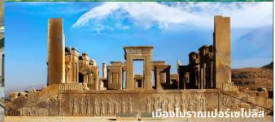
เมืองโบราณเปอร์เซโปลิส