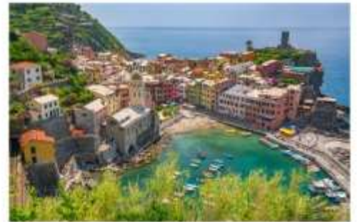
ซิงเคว เทเร

นำคณะเที่ยวชม ซิงเคว เทเร เป็นพื้นที่ที่ UNESCO ประกาศให้เป็นมรดกโลก ด้วยทำเลที่ตั้งของทั้งหมดอยู่บนภูเขาสูง โดมมีหน้าผาสูงชัน และทะเลกว้างใหญ่เป็นฉากหน้า ทำให้มีความสวยงามประดุจดั่งภาพวาด จึงเป็นอุปสรรคสำหรับผู้คนจากภายนอกในการที่จะเข้าไปให้ถึง แต่ในแง่ดีก็คือ หมู่บ้านทั้งห้ายังคงสภาพดั้งเดิมของมันมาได้ตั้งแต่ศตวรรษที่ 11 ประกอบไปด้วย Monterosso al Mare (มอนเตรอสโซ อัล มาเร), Vernazza (เวร์นาซซา), Corniglia (คอร์นีเลีย) , Manarola (มานาโรลา) และ Riomaggiore (ริโอมัจจอร์เร) **ทางบริษัทจะนำทุกท่านเที่ยวอย่างน้อย 1 จากใน 5 หมู่บ้าน**