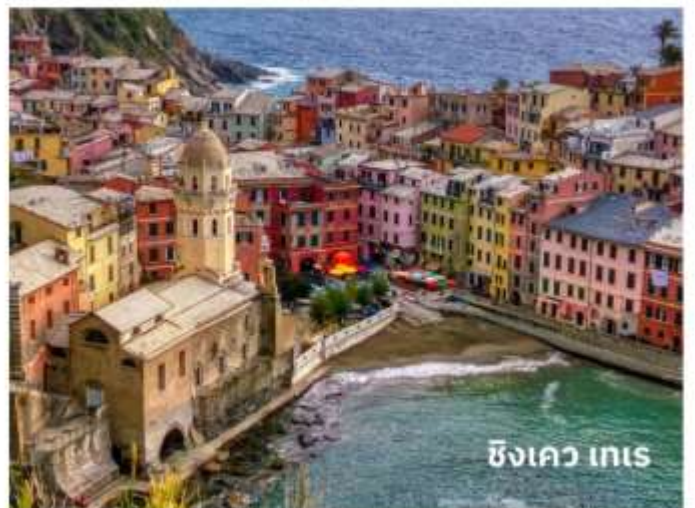
ซิงเคว เทเร

ท่านสามารถทำการสแกน QR CODE นี้ เพื่อรับชม “ซิงเควเทเร” ในรูปแบบวิดีโอ