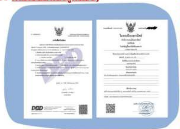
ตัวอย่างหนังสือจดทะเบียนบริษัท และ ใบทะเบียนพาณิชย์