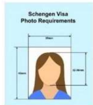
ตัวอย่างรูปถ่าย