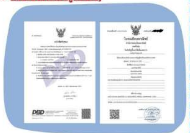
ตัวอย่างหนังสือจดทะเบียนบริษัทฯ และ ใบทะเบียนพาณิชย์