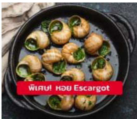
พิเศษ! หอย Escargot

เย็น ๑๑ รับประทานอาหารเย็น (เมื่อที่7) เมนูพิเศษ!! หอย Escargot