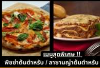
เมนูสุดพิเศษ !! พิซซ่าดินตำหรับ / ลาซานญ่าดินตำหรับ