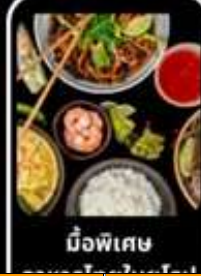
มือพิเศษ