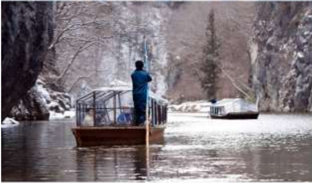
VISIT GEIBIKEI GEORGE