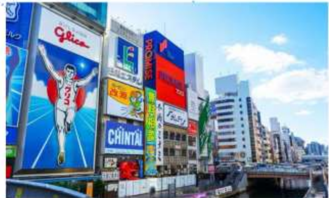
SHOPPING AT SHINSAIBASHI

"โรงงานชิกิกะโช" ชมมินิรูสมน ของฝากสุดคลาสสิกจากโอซาก้า มีขนมหวานมากกว่า 100 ชนิด รวมถึงขนมและเค้กญี่ปุ่น ท่านสามารถเพลิดเพลินกับการช้อปปิ้งขนมหวานได้ตามใจชอบ