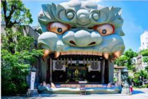
YASAKA NAMBA SHRINE