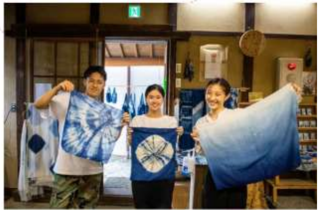
รับประทานอาหารกลางวัน ณ กัตตาคาร