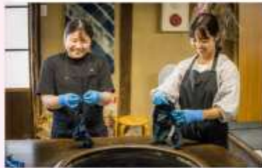
MAKE INDIGO DRING