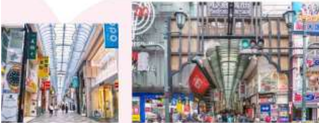
SHOP AT SHINSAIBASHI

สวรรค์ของนักช้อป "ย่านชินโซบาชิ" ถนนคนเดินที่ยาวกว่า 600 เมตร เต็มไปด้วยร้านค้ามากมายกว่า 200 ร้าน ให้คุณได้ช้อปปิ้งแบบเพลิน ไม่ว่าจะเป็เสื้อผ้าแฟชั่น เครื่องสำอาง ร้านขายยา ร้านคองกิโฮเตะ-ร้าน 100 เยน ร้านอาหาร คาเฟ่ ของฝาก ครบครัน