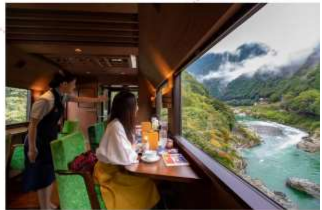
รับประทานอาหารกลางวัน ภายในรถไฟ (เมนูอาหารไม่สามารถเปลี่ยนได้)