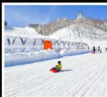
ลานสกี กาล่า ยูซาวะ