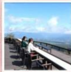
จุดชมวิวกิโยซาโตะ