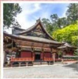
ศาลเจ้ามิตสึมิเนะ