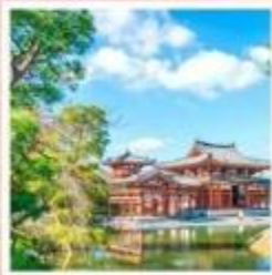
วัดเบียวโดอิน

วัดเบียวโดอิน ชม "วิหารแห่งความงามอมตะ" สัญลักษณ์ที่ถูกจารึกไว้บนเหรียญ 10 เยน ชิราคาวาโกะ หมู่บ้านมรดกโลก บ้านกึ่งโซสุคุริสวยดั่งเทพนิยาย จุดชมวิวกิโยซาโตะ ที่ราบสูงกับทิวทัศน์สุดชิล ท่ามกลางสายลม ขุนเขา และทุ่งหญ้าเปลี่ยนสี ศาลเจ้ามิตสึมิเนะ แดนศักดิ์สิทธิ์บนยอดเขา ศูนย์รวมพลังอันโด่งดังกว่า 1,900 ปี TEAMLAB PLANET ต้มตำกับโลกแห่งแสงสีไร้ขีดขอบเขต ความมหัศจรรย์เหนือจินตนาการ ล่องเรือหุบเขานากาโทโระ สัมผัสเสน่ห์เรือไม้ดั้งเดิมผ่านสายน้ำธรรมชาติและวัฒนธรรม พักออนเซ็น 1 คืน!!! // เมมูพิเศษ...บุฟเฟ่ต์ปิ้งย่าง, บุฟเฟ่ต์ชาบู กรุ๊ปสบายๆ เพียง 20 ท่านเท่านั้น!!!