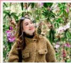
TEAMLAB PLANETS ล่องเรือหุบเขานากาโทโระ