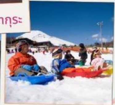
ลานสกีเยติ