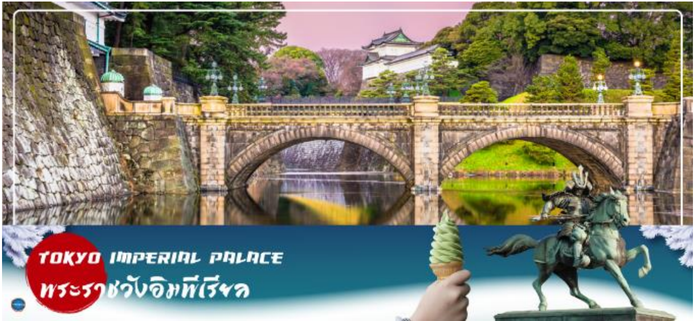
TOKYO IMPERIAL PALACE พระราชวังอิมพีเรียล

นำท่านเดินทางสู่ พระราชวังอิมพีเรียล (Imperial Palace) (ชมและถ่ายภาพด้านนอก) (ใช้เวลาเดินทางโดยประมาณ 30 นาที) เป็นที่ประทับของสมเด็จพระจักรพรรดิแห่งญี่ปุ่น ภายในพื้นที่กว้างใหญ่ประกอบด้วยพระตำหนักและอาคารต่างๆมากมาย ชม สะพานนิจูบashi (Nijubashi Bridge) หรือสะพานแว่นตา เส้นโค้งของสะพานข้ามคูน้ำสู่พระราชวังแห่งกรุงโตเกียว ที่มีชื่อเรียกว่าแว่นตาก็เพราะส่วนโค้งที่อยู่ติดกันด้านล่างสะพานนั้นมีรูปร่างเหมือนแว่นตาเมื่อสะท้อนกับผิวน้ำ ส่วนทางด้านหน้าพระราชวังเป็นอุทยานแห่งชาติโคเคียวไกเอิน (Kokyo Gaien National Garden) เป็นสวนสาธารณะขนาดใหญ่