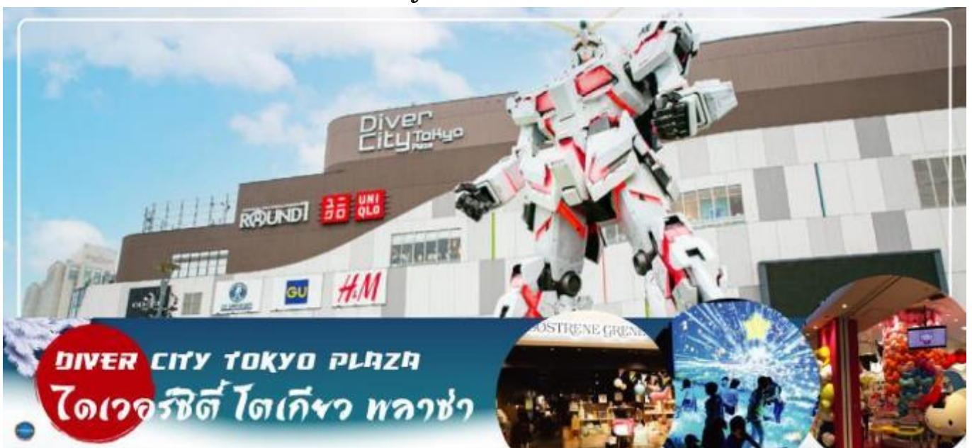
DIVER CITY TOKYO PLAZA ไดเวอร์ซิตี โตเกียว พลาซ่า

จากนั้นเดินทางสู่ ย่านโอไดบะ (Odaiba) (ใช้เวลาเดินทางประมาณ 30 นาที) คือเกาะที่สร้างขึ้นไว้เป็นแหล่งช้อปปิ้ง และแหล่งบันเทิงต่างๆ ในอ่าวโตเกียว ได้รับการปรับปรุงให้มีชื่อเสียงและเป็นที่ยอมรับในช่วงหลังของปี 1990 นอกจากนี้มีสถาปัตยกรรมที่สวยงามตั้งอยู่มากมายแล้ว แต่ก็ยังคงความเป็นธรรมชาติไว้ด้วยความอุดมสมบูรณ์ของพื้นที่สีเขียว ไดเวอร์ซิตี โตเกียว พลาซ่า (Diver City Tokyo Plaza) เป็นห้างดังอีกห้างหนึ่ง ที่อยู่บนเกาะ โอไดบะ จุดเด่นของห้างนี้ก็คือ หุ่นยนต์กันดั้มขนาดเท่าของจริง ซึ่งมีขนาดใหญ่มาก ในบริเวณห้าง อิสระช้อปปิ้งตามอัธยาศัย