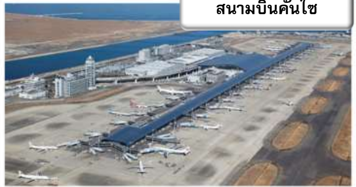
สนามบินคันไซ