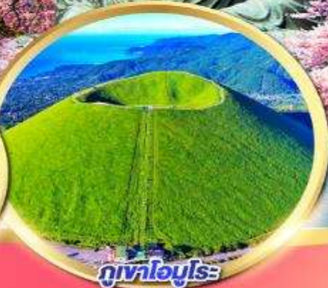
ภูเขาโอมูโระ