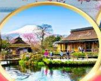
หมู่บ้านน้ำใสโอชิโนะฮักโกะ