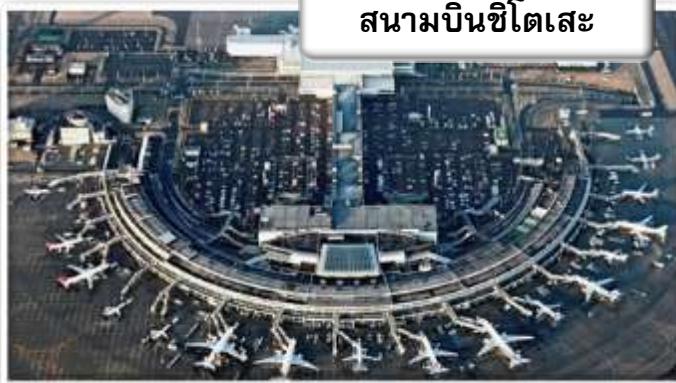
สนามบินชิโตเสะ

เวลา 23.45 น. ออกเดินทางสู่ สนามบินชิโตเสะ ฮอกไกโด ประเทศญี่ปุ่น โดยสายการบินไทย เที่ยวบินที่ TG 670