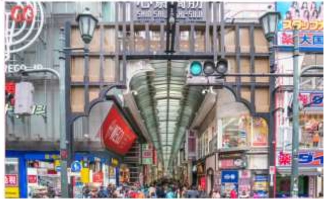
อิสระอาหารกลางวันตามอัธยาศัย (ไม่รวมในรายการ)