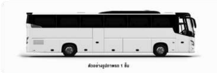
ตัวอย่างรูปภาพรถ 1 คัน

ค่าโรงแรมที่พัก ค่าที่พักตามที่ระบุในรายการหรือเทียบเท่าระดับเดียวกัน (พักห้องละ 2 ท่าน) หากประเภทห้องที่ท่านริเสวนาเป็นอาทิ เช่น ริเสวนาห้องพักเป็น TWIN BED หรือ DOUBLE BED ทางบริษัทขอสงวนสิทธิ์ในการปรับประเภทห้องพัก เป็นตามที่โรงแรมมีอยู่ โดยไม่ต้องแจ้งให้ทราบล่วงหน้า