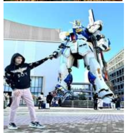
หุ่นกันดั้ม ชื่อ RX93 FF Nu Gundam

เดินทางต่อไปยัง ร้านค้า DUTY FREE ให้ท่านได้ช้อปปิ้งสินค้าปลอดภาษีที่มีคุณภาพ อาทิ เครื่องสำอาง โฟมล้างหน้า(แนะนำ) อาหารเสริม ขนม เครื่องใช้ต่างๆ ฯลฯ ...จากนั้นแวะ แชะรูปกับหุ่นกันดั้มยักษ์ ณ ห้าง LaLaport (หากมีเวลาพอ) มีขนาดใหญ่กว่า Unicorn Gundam ที่โตเกียวและใหญ่กว่า RX93 FF Gundam ที่ Gundam Factory Yokohama เรียกได้ว่าเป็นแลนด์มาร์คสำคัญของเมืองฟูกูโอกะในปัจจุบัน ...จากนั้นอิสระให้ท่านช้อปปิ้ง ย่านเทนจิน (Tenjin) หรือ ย่านฮาคาตะ (Hakata) เป็นย่านช้อปปิ้งขนาดใหญ่ใจกลางเมือง รวบรวมแหล่งบันเทิง อย่างครบครัน ไม่ว่าจะเป็นตึกต้นไม้ ร้านค้าที่น่าสนใจ และบรรยากาศสุดคลาสสิก หรือจะเป็นย่านของกินอร่อยๆ อย่างย่านยะไต (Yatai) หมายถึง ชุมชนอาหารที่มีขนาดไม่ใหญ่มาก ที่รวมร้านอาหารแบบฉบับท้องถิ่นเอาไว้มากมาย