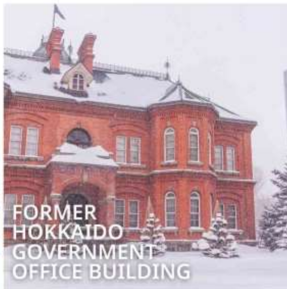
FORMER HOKKAIDO GOVERNMENT OFFICE BUILDING