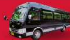
BUS (10-18 ท่าน)