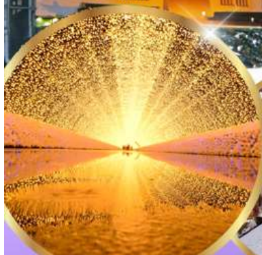
นาคานะ โนะ ซาโตะ