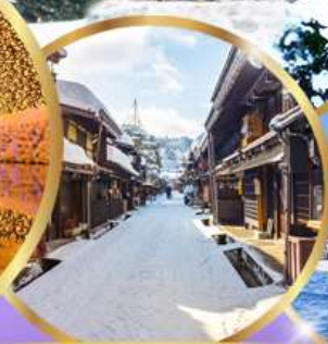
ทาคายามา