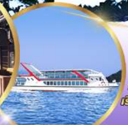
ล่องเรือ ทะเลสาบ ฮามานะ