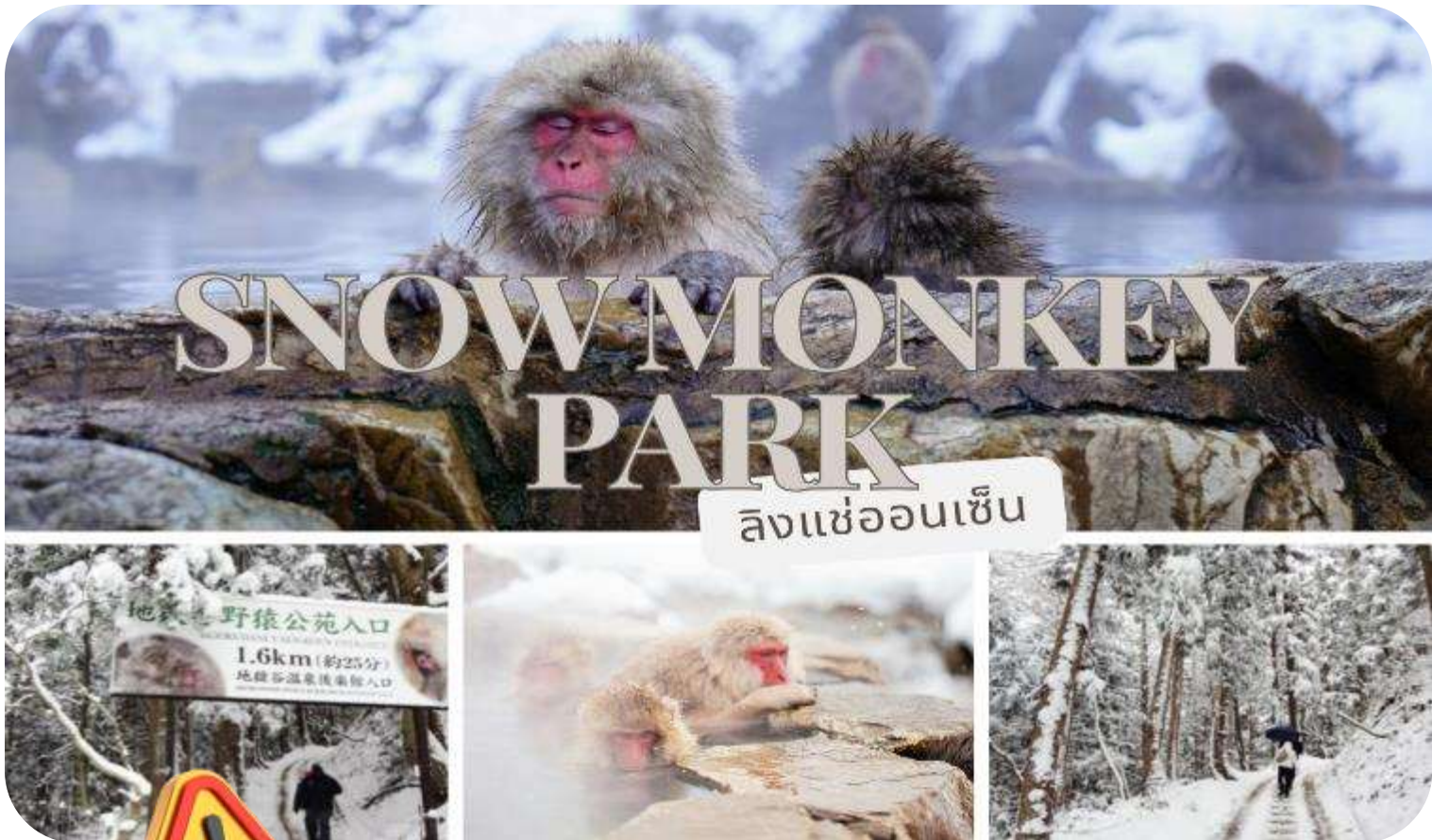
ลิงแช่ออนเซน

นำท่านเดินทางสู่ สวนลิงจิโกคุดาบิ (Jigokudani Monkey Park) หรือสวนลิงออนเซน (Snow Monkey Park) เป็นส่วนหนึ่งของอุทยานแห่งชาติโจชินเอ็ตสึ โคเจ็น (Joshinetsu Kogen) ตั้งอยู่ในหุบเขาจิโกคุดาบิ (Jigokudani) ที่มีความหมายว่า “หุบเขานรก” เนื่องจากบริเวณของหุบเขายังคงมีไอน้ำและน้ำพุร้อนที่ออกมาจากรอยแยกเล็กของพื้นดิน เป็นแหล่งท่องเที่ยวอีกแห่งหนึ่งที่ได้รับความนิยมจากนักท่องเที่ยวที่มาเยือนเมืองนาగాโนะ (Nagano) นำท่านเดินเท้าเข้าไปยังบ่อออนเซนที่มีฝูงลิงญี่ปุ่นแก้มแดงกำลังแช่ออนเซนคลายหนาวกันอย่างสบายใจ อิสระให้ท่านเก็บภาพความน่ารักของฝูงลิงแก้มแดง และบรรยากาศความสวยงามรอบๆ บ่อออนเซนแห่งนี้