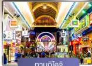
ทานุกิโคจิ