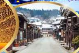
ทาคายามา