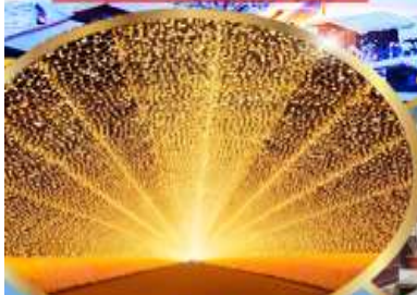
นาบาระ โนะ ซาโตะ