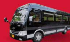
BUS (10-18 ท่าน)