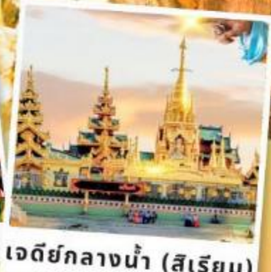
เจดีย์กลางน้ำ (สีเรียม)