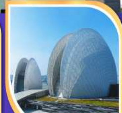
โรงละครหอยไข่มุก