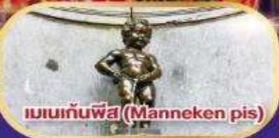
แมนเนกันพีส (Manneken pis)