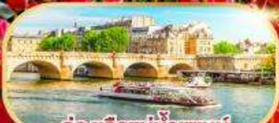
ล่องเรือแม่น้ำแซนน์