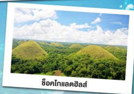
ช็อคโกแลตฮิลล์