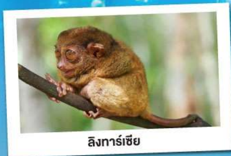
ลิงทาร์เซียร์