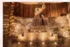
เหมืองเกลือวิลิชก้า