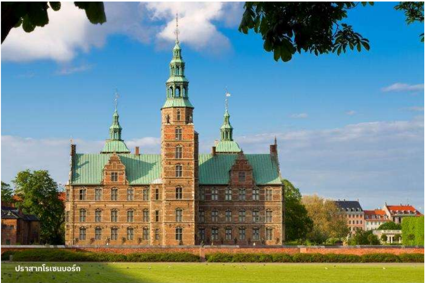
ปราสาทโรเซนบอร์ก