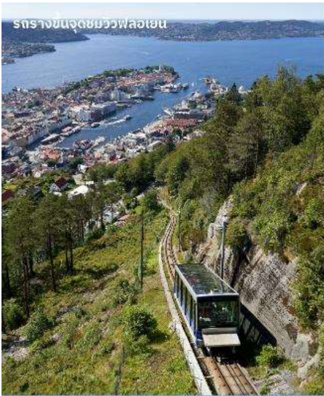
รถรางขึ้นจุดชมวิวฟลอยเอน

หลังจากนั้นนำท่านเดินทางสู่ ยอดเขาฟลอยเอน (Floyen) โดยรถรางไฟฟ้า ผ่านแมกไม้ทิวทัศน์สวยๆ งามๆ ตลอดทาง แม้จะเป็นฤดูหนาวแต่สำหรับเบอร์เก้นแล้วนี่คือเมืองที่มีอากาศไม่หนาวจัดเท่าเมืองอื่นๆ ของนอร์เวย์จากการที่มีแนวเทือกเขาล้อมกันกระแสน้ำอุ่นในขณะที่มีกระแสน้ำอุ่นเชื่อมต่อกับทะเลเข้าสู่เมือง ชมวิวกันเพลินๆ ก่อนที่รถรางจะเข้าจอดที่สถานีบนยอดเขาในระดับความสูงเหนือระดับน้ำทะเล 320 เมตร ทำให้มองเห็นไกลไปถึงท่าเรือใหญ่ที่มีทั้งเรือรบและเรือสำราญหรู เห็นบ้านเรือนและผู้คน เห็นถึงความ เป็นเมืองท่องเที่ยวที่มีครบทุกรูปแบบจากวิวพาโนรามาที่ทำให้มองเห็นภาพความเป็นเบอร์เก้นได้ชัดเจนที่สุด