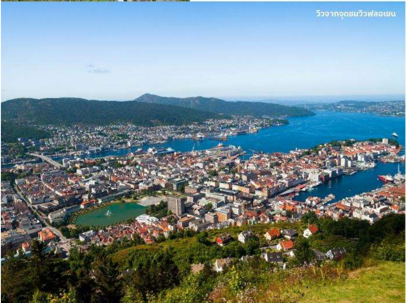
วิวจากจุดชมวิวฟลอยเอน

หลังจากนั้นนำท่านเดินทางสู่ ยอดเขาฟลอยเอน (Floyen) โดยรถรางไฟฟ้า ผ่านแมกไม้ทิวทัศน์สวยๆ งามๆ ตลอดทาง แม้จะเป็นฤดูหนาวแต่สำหรับเบอร์เก้นแล้วนี่คือเมืองที่มีอากาศไม่หนาวจัดเท่าเมืองอื่นๆ ของนอร์เวย์จากการที่มีแนวเทือกเขาล้อมกันกระแสน้ำอุ่นในขณะที่มีกระแสน้ำอุ่นเชื่อมต่อกับทะเลเข้าสู่เมือง ชมวิวกันเพลินๆ ก่อนที่รถรางจะเข้าจอดที่สถานีบนยอดเขาในระดับความสูงเหนือระดับน้ำทะเล 320 เมตร ทำให้มองเห็นไกลไปถึงท่าเรือใหญ่ที่มีทั้งเรือรบและเรือสำราญหรู เห็นบ้านเรือนและผู้คน เห็นถึงความ เป็นเมืองท่องเที่ยวที่มีครบทุกรูปแบบจากวิวพาโนรามาที่ทำให้มองเห็นภาพความเป็นเบอร์เก้นได้ชัดเจนที่สุด