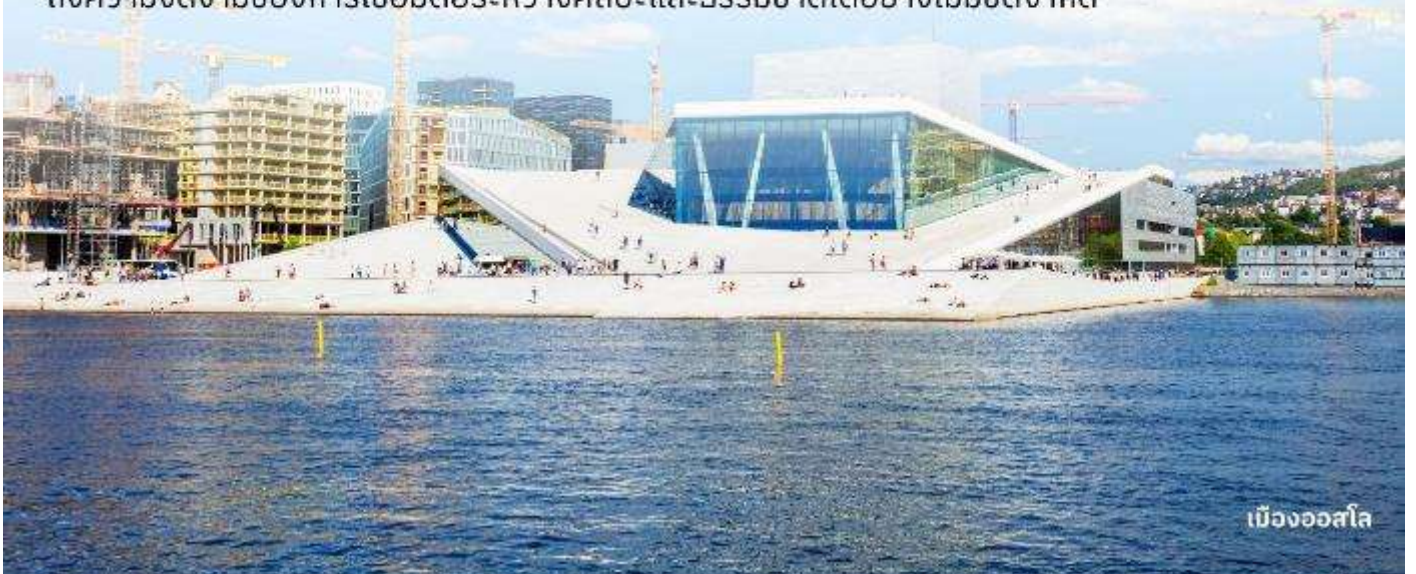
เมืองออสโล

นำท่านถ่ายรูป Operahuset ในออสโล (Oslo Opera House) เป็นสถาปัตยกรรมที่มีความเป็นเอกลักษณ์อย่างมาก สร้างบนพื้นที่แหลมที่สวยงามของกรุงออสโล ทุกท่านจะได้ประสบการณ์ที่สะท้อนถึงความงดงามของการเชื่อมต่อระหว่างศิลปะและธรรมชาติได้อย่างไม่มีขีดจำกัด